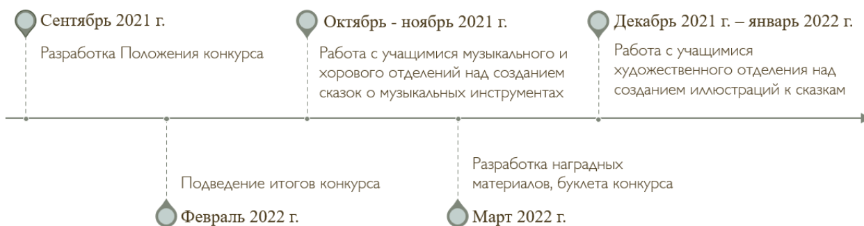
Рис. 1. Этапы работы над конкурсом

Итогом конкурса стал творческий проект (продукт) в виде буклета, который можно оценить и как наградной материал, и как увлекательное методическое пособие для изучения мира музыкальных инструментов ребятами младшего школьного возраста.